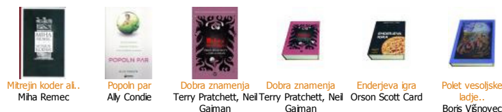
Mitrejin koder al. Miha Remec