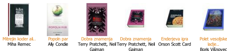
Mitrejin koder al. Miha Remec