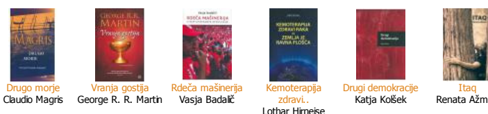
Drugo morje Claudio Magris