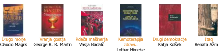
Drugo morje Claudio Magris